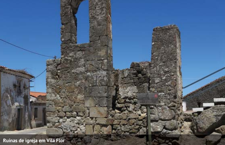
Ruínas de igreja em Vila Flor