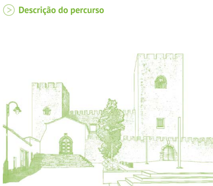
Castelo de Amieira do Tejo. De planta quadrangular e dotado de quatro torres, sendo a do canto norte a Torre de Menagem, que também foi paço.

O percurso inicia-se em Amieira do Tejo, uma das doze vilas da Ordem de Malta. Sai do largo da Junta de Freguesia pela estrada alcatroada e segue por um caminho entre muros, azinheiras e oliveiras. Após uma ligeira subida, surgem as estevas, as giestas, os sobreiros e alguns vinhedos.